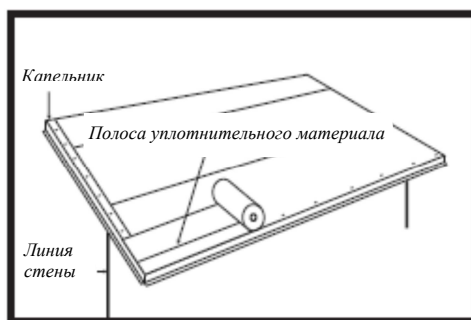
Рис. 2 Нанесение на подкос