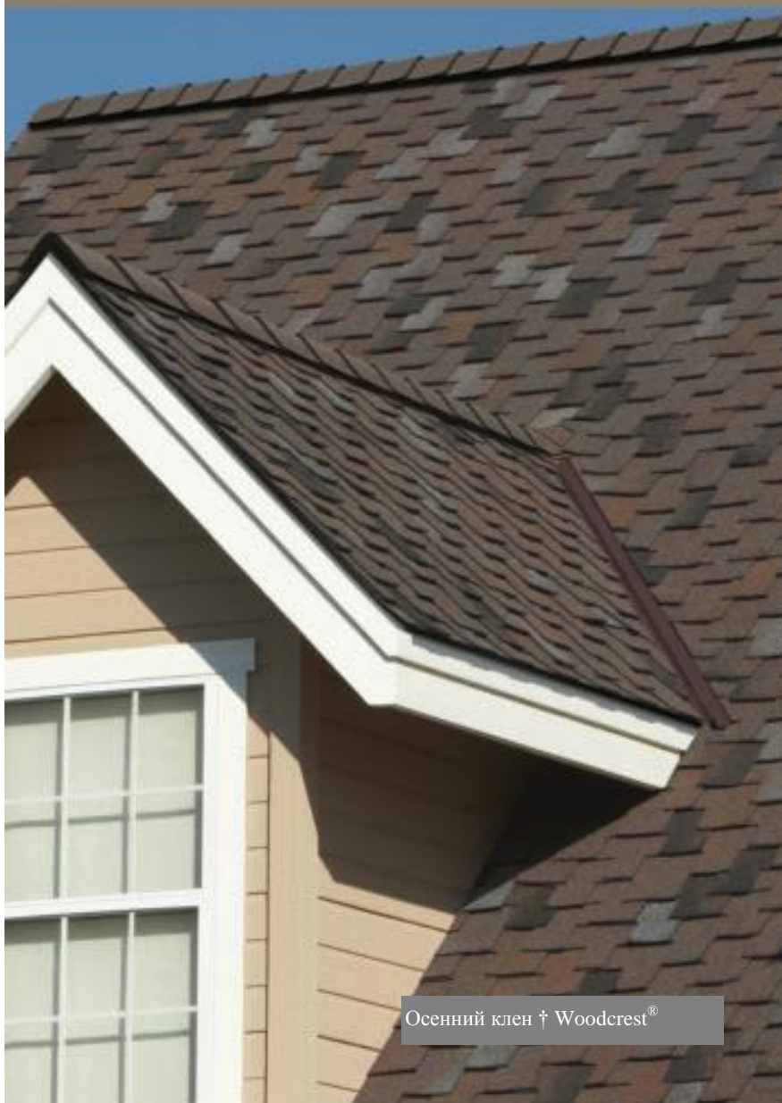
Осенний клен † Woodcrest®

Толстые, невероятно красивые кровельные плитки Woodcrest® используют свой незамысловатый и текстурированный внешний вид для создания внешнего вида деревянного гонта. Их естественный вид дополняется долговечностью, которая привлекает не в меньшей степени, ведь данные кровельные плитки подкреплены ограниченной пожизненной гарантией*, ограниченной гарантией стойкости к воздействию ветра, дующего со скоростью до 90 миль в час,* и ограниченной гарантией стойкости к воздействию водорослей*. Плюс, наши совпадающие по цветам кровельные плитки для ребер и коньков Owens Corning™ добавляют архитектурный интерес к Вашему дому