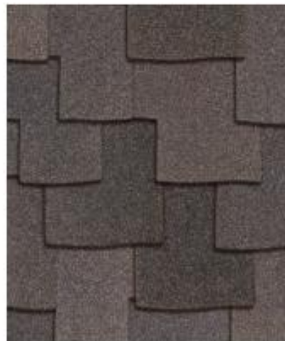
Мескитовое дерево †