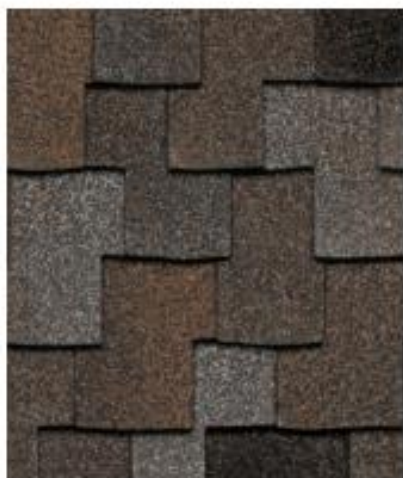
Осенний клен †