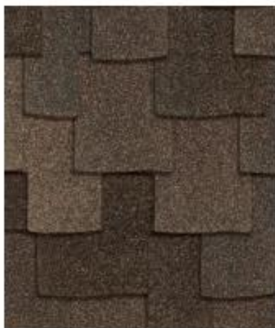
Каштановое дерево †